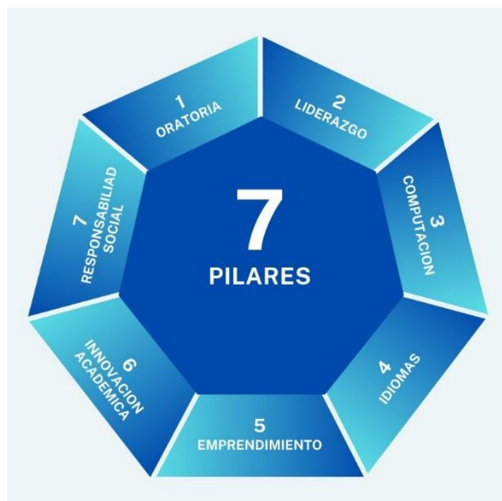
Figura 3: Formación Académica