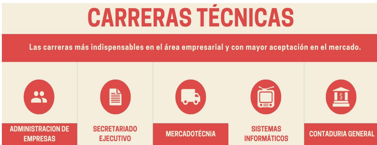
Figura 2: Oferta Académica